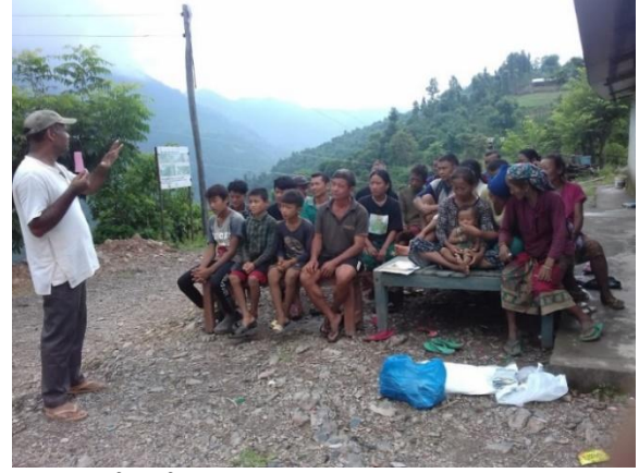
हिउदे तारिकाको स्थलगत अनुशिक्षण तथा विउ वितरण