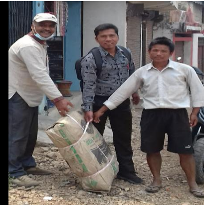
सिंचाइ टंकी तथा टनेलका लागि सिलपौलीन सहयोग