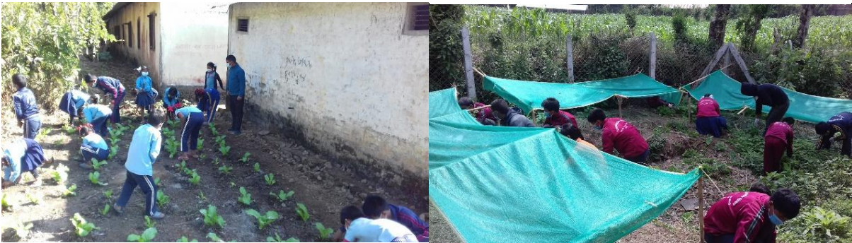
विद्यालय कार्यक्रमको भलक

यस परियोजनाका विभिन्न कार्यक्रमहरु मध्य विद्यालय संलग्नता पनि एक कार्यक्रम हो । बालबालिकाहरुमा वातावरण तथा सरसफाइ र विरुवा संरक्षण तथा संब्रधनमा सचेतना वृद्धि गराउने सोचका साथ संचालित यस कार्यक्रममा जलवायु शिक्षा कार्यक्रम, विद्यालय कम्पाउण्ड भित्र कफी विरुवा रोपण कार्यक्रम संचालन गरिएको छ । जलवायु कक्षामा बालबालिकालाई जलवायु परिवर्तन के हो, किन र कसरी हुन्छ, यस प्रभाव कस्तो छ र सो प्रभावसंग जुध्नका लागि अपनाइने उपायहरुका बारेमा जानकारी गराइन्छ । विद्यालय कम्पाउण्ड भित्र कफी विरुवा रोपणका लागि बालबालिकाहरुलाई कफी लगाउने तरिका, रोपण गर्ने दुरी, खाडल खन्ने तरिका र मल जल गर्ने तरिकाका तथा विद्यालय सरसफाइको बारेमा पनि जानकारी गराउनुका सरसफाइ पनि गर्न लगाइन्छ, ता कि बालबालिकाले कार्यक्रमको समग्र सन्देश हरेक घरहरुमा पुऱ्याउन ।