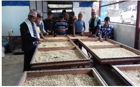
कफी बगैचा तथा प्रसोधन स्थल अवलोकन