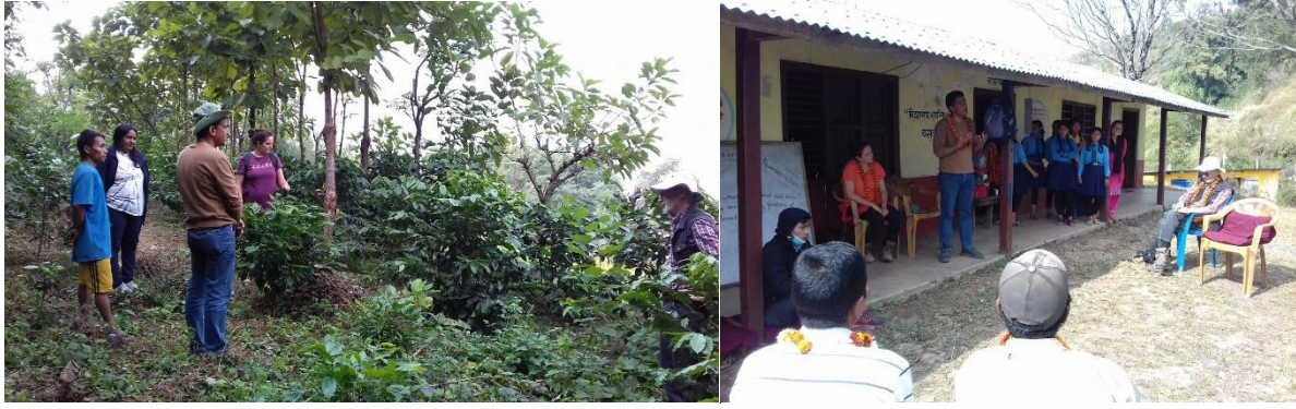
कफी अनुगमन तथा सामुदायिक छलफल