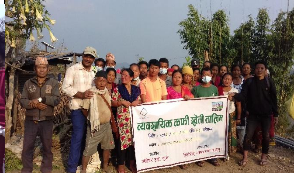
कफी खेति तालिमको भ्रमण