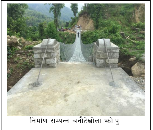
निर्माण सम्पन्न चनौटेखोला भो.पु.

भोलुङ्गे पुल कार्यक्रम” निरन्तर संचालन गरिँदै आएको छ । सामुदायिक भोलुङ्गे पुल स्थानीय समुदायद्वारा पुलको आवश्यकता महशुस गरी समस्याको विश्लेषण सहित आवश्यक स्रोत साधनको पहिचान गरी स्थानीय समुदायको अगुवाई तथा व्यवस्थानपनमा पुल निर्माण गरिन्छ । यस कार्यक्रमले समुदायको स्वामित्व बोध गराई पुलको मर्मत संभार रेखदेखमा समेत स्थानीयको सहभागिता सुनिश्चित गराउँछ जसले गर्दा पुलको दीर्घकाल सम्म जतन तथा उपयोगको सुनिश्चितता हुन्छ । समुदायलाई जीवन यापनको लागि आवश्यक सेवा सुविधाको पहुँचमा सहजता तथा दिगोपन ल्याउँछ । हिकोडेफको मुख्य भूमिका भनेको पुलको आवश्यकता पहिचानमा सहजिकरण, निर्माण पूर्वको चरणमा हुने सम्पूर्ण प्रकृत्यामा सहयोग र निर्माण देखि सम्पन्न गरिदाँसम्मको अवधिमा सामाजिक तथा प्राविधिक कार्यमा समुदायलाई सहयोग उपलब्ध गराई पुलको दीगोपनाका लागि मर्मत सम्भार समिति गठन गर्ने र स्थानीयवासीको सुनिश्चितता कायम गराउने हो ।