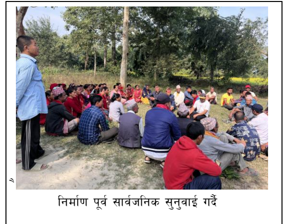
निर्माण पूर्व सार्वजनिक सुनुवाई गर्दै