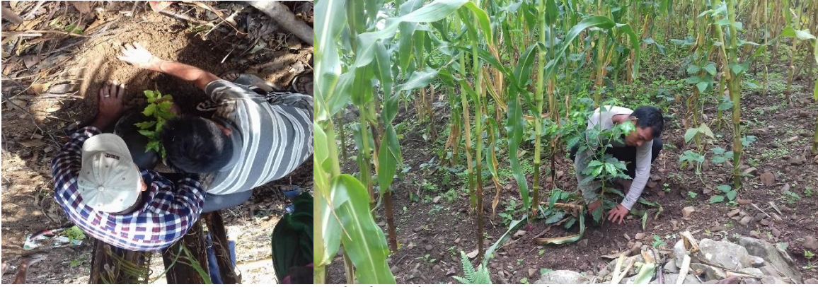
कफी विरुवा रोपण दुलुगा र लाहापे

परियोजना अन्तरगत यस वर्ष ४ कृषक समुहका ११५ कृषक परिवारलाई परियोजनाको तर्फबाट कुल ३४७० कफीको विरुवा सहयोग गरि रोपण गरिएको छ भने १५ घरधुरि कृषकहरूले आफ्नै तर्फबाट १०६० वटा कफी विरुवा व्यवस्थापन गरि रोपण गरेका छन् । यसरी यस अवधिमा कुल १३० कृषकहरूद्वारा ४५३० कफीका विरुवाको रोपण गरीएको छ । एक घर एक व्यक्तिलाई कफी खेति सम्बन्धि दिइएको तालिमले र कफी लगाउनु पर्छ भन्ने विषयमा गरिएको नियमित परियोजनाको तर्फबाट गरिएको सहजीकरण तथा स्थलगत अनुशिक्षणका कारण यस वर्ष पनि कृषकहरू कफी खेति प्रति थप उत्साहीत भएका छन् ।