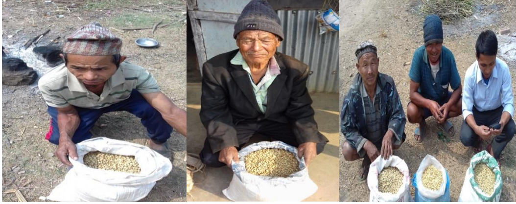
आ आफ्ना विक्री योग्य कफी पार्चमेन्टका साथ कृषकहरू

यस वर्ष देखि यस परियोजना आवधिमा रोएका कफी विरुवाबाट पनि कफी उत्पादन हुन थालेको छ । यस वर्ष परियोजना क्षेत्रका ३४ जना कृषकहरूले २६४ के.जी. कफी पार्चमेन्ट तयार गरी विक्री गरेका छन् । जसबाट रु. १०५६०० आम्दानि पनि गरेका छन् जसले अन्य सबैलाई हौसला प्रदान गरेको छ र समुदायमा कफी पल्पीङ्ग गरि कफी पार्चमेन्ट बनाउने क्षमता अभिवृद्धि भएको छ ।