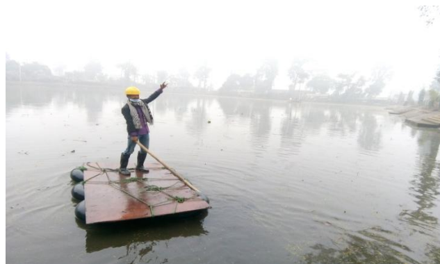
काम गर्नु अगाडि र पछाडी तरगौली तालको अवस्था