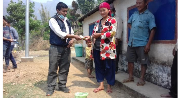
कफी पार्चमेन्ट विक्री पछि रकम हस्तान्तण

यस कार्यक्रम संचालन हुनु भन्दा अगाडी यस क्षेत्रमा लगाइएका कफी चेरी बोटमै पाकेर भरेर जाने अवस्था र कसै कसैले टिपेहाले पनि प्रशोधन प्रक्रिया नजानेर कमै मात्रामा कफीको पार्चमेन्ट तयार हुने गर्दथ्यो । कफि तालिममा भएको छलफलको फलस्वरुप हाल सम्म कुनै परिमाणमा कफी पार्चमेन्ट विक्री नगरेका कृषकहरुमा लाहापेका १५ जना, वसेनीका १० जना र रिपाहाका ५ जना गरि कुल ३० जना कृषकहरुले करिव ८४.५ के.जी. कफी पार्चमेन्ट विक्री गर्न योग्य हुने गरि तयार गरेर ३० के.जी स्थानिय क्षेत्रबाट प्रति के.जी रु ४००। का दरमा र ५४.५के.जी. काठमाडौंका लागि प्रति के.जी रु ५००। का दरमा विक्री गर्न सफल भएका छन् ।