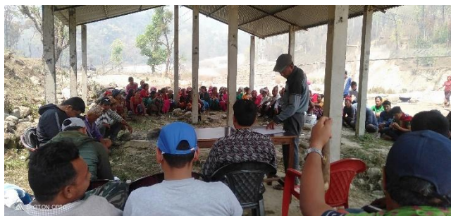
सार्वजनिक लेखा परीक्षण