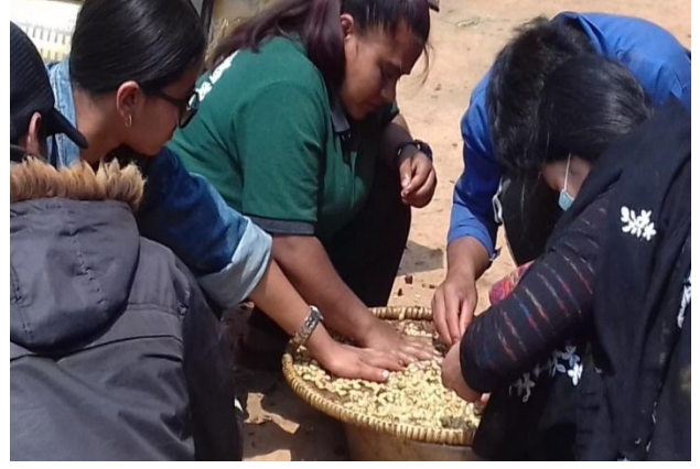
फिल्डमा अभ्यास गर्दै ओ.जे.टी .स्वयमसेवीहरू

यस कार्यक्रममा कृषकहरूलाई प्रत्यक्ष प्राविधिक सल्लाहका लागि ६ जना OJT कृषि प्राविधिकहरूलाई परिचालन गरियो । त्यसमध्ये २ जना महिला हुप्सेकोट ४ रिपाहामा र ४ जना (२ महिला २ पुरुष) जेटिए ओ जे टी स्वयंसेवक बौदीकाली ६ लाहापेमा परिचालित भए । वहाँहरूलाई कार्यस्थलमा परिचालन गर्नु अगाडी एक दिने अभिमुखीकरण गरि कार्यस्थलमा खटाइएको थियो । यस अभिमुखीकरणमा Layer Farming for Adaptation Project को बारेमा जानकारी गराउनाका साथै समुदायमा काम गर्ने तौरतरिका र कार्यालयको नीतिनियमको बारेमा जानकारी गराइएको थियो । स्वयंसेवकहरूको शिप निखार्नलाई परियोजनाबाट संचालित कृषक स्तरको कफी खति तालिममा पनि सहभागि गराईयो ।