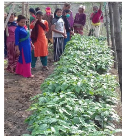
रिपाहामा कफी रोपणको तयारी

यस अवधिमा परियोजनाको सहयोगमा स्थापना भएको नर्सरीहरुबाट कफी विरुवा उपलब्ध गराइ वसेनी, रिपाहा र लाहापेका ३ ओटा कृषक समुहका ५० कृषकहरुले (१ दलित र ४९ जनजाति ) थप २४६० कफीको विरुवा रोपण गरेका छन् समुदायका यी कृषकहरुले आफ्नै तर्फबाट कफी विरुवा व्यवस्थापन गरि रोपण गर्ने क्रम पनि अझै जारी छ । यसरी गत साल र यस साल गरि ९२ कृषकले ५७१५ (३२५५+२४६०) कफीका विरुवाको रोपण गरेको छन् । यसरी रोपिएका कफीका विरुवा ७० प्रतिशत सरेको अवस्था छ । एक घर एक व्यक्तिलाई कफी खेति सम्बन्धि दिइएको तालिमले र कफी लगाउनु पर्छ भन्ने विषयमा गरिएको नियमित सहजीकरणले बन्दाबन्दीको अवस्थामा पनि कृषकहरु कफी खेति प्रति उत्साह जगाउन सफल भईएको छ ।