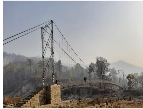
निर्माण सम्पन्न धोब्लेघाट भो पु , विनयी त्रिवेणी

हिमालयन सामुदायिक विकास मञ्च (हिकोडेफ) ले सरकारी तथा गैर सरकारी संघ संस्थासँगको साभेदारीमा संचालन गरेको कार्यक्रमहरू मध्ये “सामुदायिक भोलुङ्गे पुल कार्यक्रम” पनि एक हो । सामुदायिक भोलुङ्गे पुल स्थानीय समुदायद्वारा पुलको आवश्यकता महशुस गरी समस्याको विश्लेषण सहित आवश्यक स्रोत साधनको पहिचान गरी स्थानीय समुदायको अगुवाई तथा व्यवस्थानपनमा पुल निर्माण गरिन्छ । यस कार्यक्रमले समुदायको स्वामित्व बोध गराई पुलको मर्मत संभार तथा रेखदेखमा समेत स्थानीयको सहभागिता सुनिश्चित गराउनेछ जसले गर्दा पुलको दिर्घकाल सम्म समुदायलाई जिवनयापनको लागि आवश्यक सेवा सुविधाको पहुचमा सहजता ल्याउँछ । हिकोडेफको मुख्य भूमिका भनेको पुलको आवश्यकता पहिचानमा सहजिकरण, निर्माण पूर्वको चरणमा हुने सम्पूर्ण प्रकृत्यामा सहयोग र निर्माण देखी सम्पन्न सम्मको अवधिमा सामाजिक तथा प्राविधिक कार्यमा समुदायलाई सहयोग उपलब्ध गराई पुलको दीगोपनाका लागि मर्मत सम्भार समिति गठन गर्ने र स्थानीयवासीको रोजगारीको सुनिश्चितता कायम गराउने हो ।