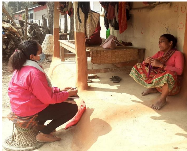
गृहभेट मार्फत परामर्श गरिँदै

कार्यक्षेत्रका वैदेशिक रोजगारका क्रममा आएका मनोसामाजिक समस्याहरु संकलन गरियो । रिटर्नी, संचार साधन, विद्यालय सचेतना कार्यक्रम, स्थानिय महिला अगुवा, समुह मनोपरामर्श, मनोसामाजिक परामर्शकर्ता स्वयम्का माध्यमबाट वैदेशिक रोजगारका कारणबाट समस्यामा परेका ११८ व्यक्ति ( २३ पुरुष, ९५ महिला) तथा तिनका परिवारको समस्या पहिचान गरी उनीहरुको मनोगत समस्या पत्ता लगाइ मनोसामाजिक परामर्शकर्ताद्वारा समस्या न्युनिकरण गरिएको छ । साथै गत वर्षका ८ जना पुरुष तथा ४२ जना महिला गरी ५० जना मनोसामाजिक समस्यामा रहेका सेवाग्राहीहरुलाई फलो अप गर्ने कार्य गरियो ।