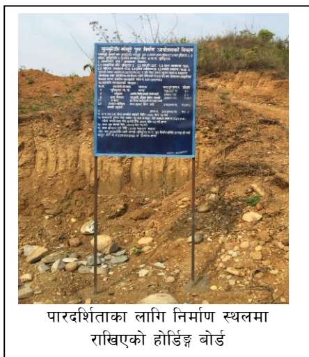
पारदर्शिताका लागि निर्माण स्थलमा राखिएको होर्डिङ्ग बोर्ड