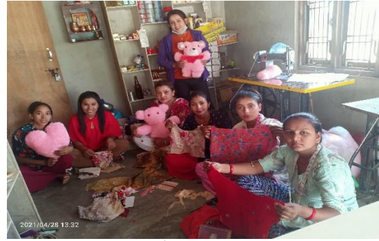
व्यावसाय शुरु गरेपछि वित्तीय साक्षरता कक्षाका सहभागिहरु