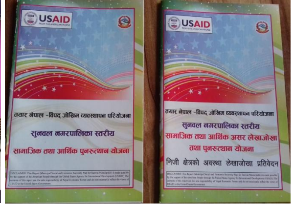
प्रमाणीकरण गोष्ठीको भ्रमक र प्रकाशीत प्रतिवेदन