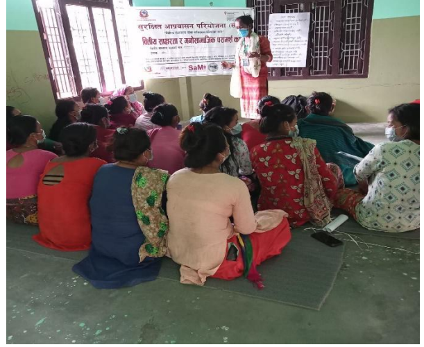
मध्यविन्दुमा संचालित एक वित्तीय साक्षरता कक्षा

वैदेशिक रोजगारमा गएका परिवारहरूलाई दिगो जीवन निर्वाहका लागि वैदेशिक रोजगारीमा आर्जन गरेको रकमलाई लिन सचेतिकरण गर्ने तथा रेमिटान्सबाट प्राप्त रकमको सहि र व्यवस्थित सदुपयोगका लागि योजना निर्माणमा सघाउ पुऱ्याउने उद्देश्यका साथ यस अवधिमा विकास आयोजना सेवा केन्द्र (डिप्रोक्स), नेपालको प्राविधिक सहयोगमा वित्तीय साक्षरता कार्यक्रम गत वर्ष नै गैडाकोट नगरपालिकामा ४ वटा समूह, मध्यविन्दु नगरपालिकामा ४ वटा समूह, कावासोती नगरपालिकामा ४ वटा समूह तथा विनयी त्रिवेणी गाउँपालिकामा मा ३ समूहमा सर्वेक्षण गरी कक्षा संचालन गरियो । यस वर्ष कावासोतीका ४ वटा समूहमा १०७ जना, गैडाकोटका ४ वटा समूहका ९३ जना, मध्यविन्दुका ४ वटा समूहका १०१ जना तथा विनयी त्रिवेणीका ३ वटा समूहका ६८ जना गरी १५ समूहमा जम्मा ३६८ जना सहभागीहरू रहेका छन् ।