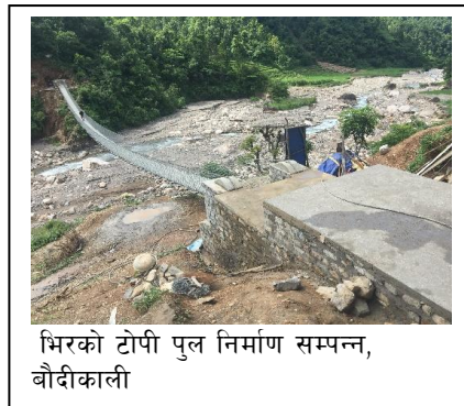
भिरको टोपी पुल निर्माण सम्पन्न, बौदीकाली