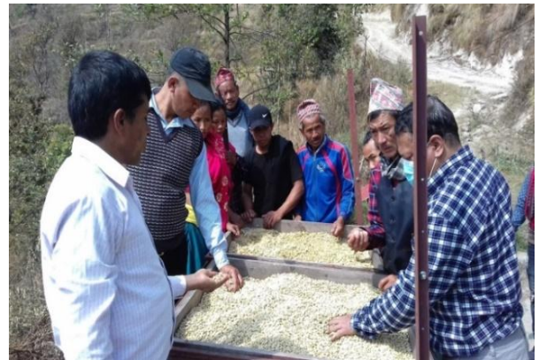
सहभागीहरूबाट कफी बगैचा तथा पल्पीङ्ग केन्द्र अवलोकन