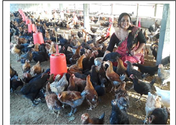
लोकल कुखुरापालनमा रम्दै सहकारीका अध्यक्ष