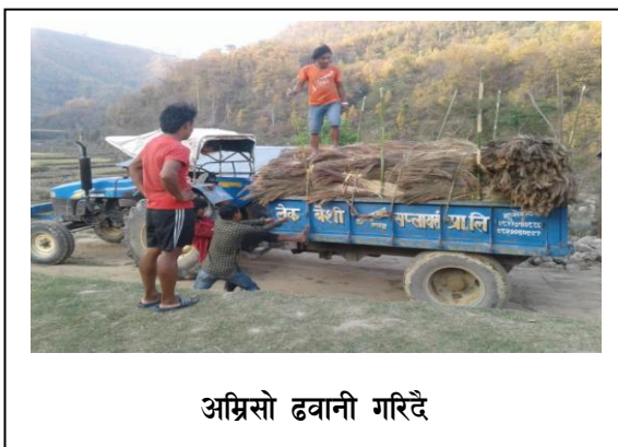
अग्रिसो ढवानी गरिदै