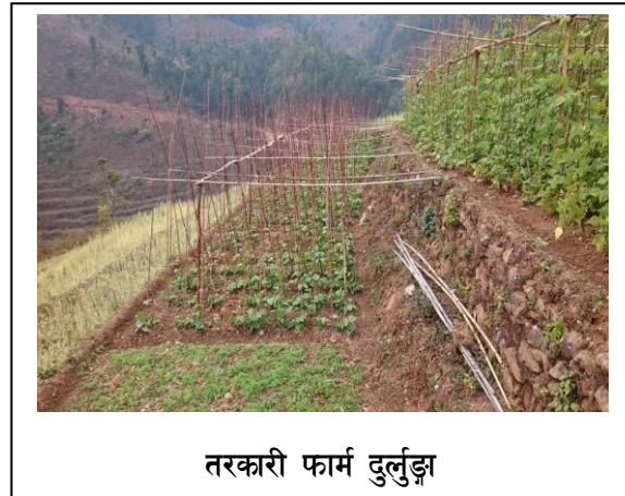
तरकारी फार्म दुर्लुङ्गा

हिकोडेफले सन् २००८ देखि द ग्लासियर ट्रष्टसंगको साभेदारितामा जलवायु परिवर्तन तथा जलस्रोत व्यवस्थापन सवालमा नवलपरासी जिल्लाका दुर्गम क्षेत्र जहाँ आफ्नो जिविकोपार्जनका लागि १००% समुदाय कृषीमा आश्रित हुन्छन् उनीहरूका लागि परियोजना संचालन गरिरहेकोछ । किनकी जलवायुको प्रभाव मुलतः जलस्रोतमा पर्दछ र किसानहरू पानी विना खेतीपाती गर्न असमर्थ हुन्छन् । यस कुरालाई मनन गर्दै साभेदारहरूले यो जलवायु परिवर्तन सिकाई तथा