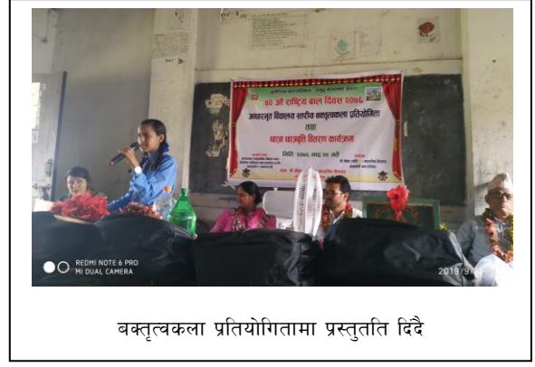
बक्तृत्वकला प्रतियोगितामा प्रस्तुतार्ति दिदै

ल्याएको छ । यस कार्यक्रमबाट हिकोडेफका मित्रहरूको एउटा संजाल निर्माण गरी छरिएर रहेका मित्रहरूलाई एकताबद्ध गराउने र हिकोडेफलाई आर्थिक तथा नैतिक समर्थन र स्रोत जुटाउने प्रयास गरिनेछ । जसले गर्दा हिकोडेफको पहिचान विश्वव्यापीरूपमा बढ्ती हुने विश्वास लिइएको छ । हाल गैरसरकारी संस्थाहरूलाई दातामुखि भई दाताको अनुदानमा आश्रित संस्थाहरूको हेरीरहेको परिपेक्षमा यसबाट संस्थाले आन्तरिकरूपमा आर्थिक स्रोत संकलन गरी समुदायको माग तथा आवश्यकता बमोजिम कार्यक्रमहरू संचालन गर्न सकिने छ । हिकोडेफका मित्रहरूलाई आर्थिक सहयोगीकोरूपमा मात्र नहेरी नैतिक तथा बौद्धिक सहयोगीकोरूपमा पनि हेरिएकोछ । जसले गर्दा कार्यक्रम तर्जुमा देखि कार्यान्वयन हुँदै अनुगमन मुल्यांकन सम्म मित्रहरूको भुमिकाको निक्कै गरि सहभागि गराइने छ ।