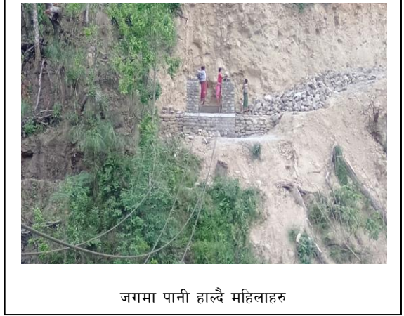
जगमा पानी हाल्दै महिलाहरु