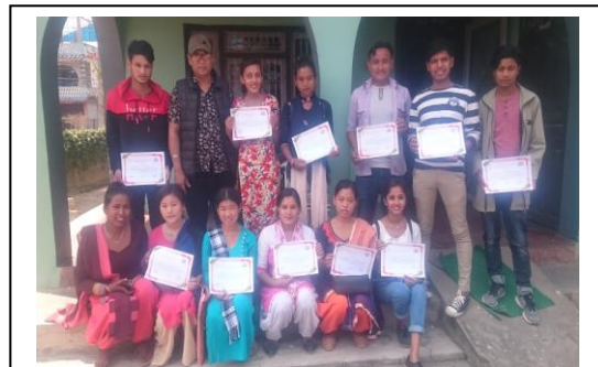
स्वयंमसेवकहरूलाई प्रमाणपत्र वितरण