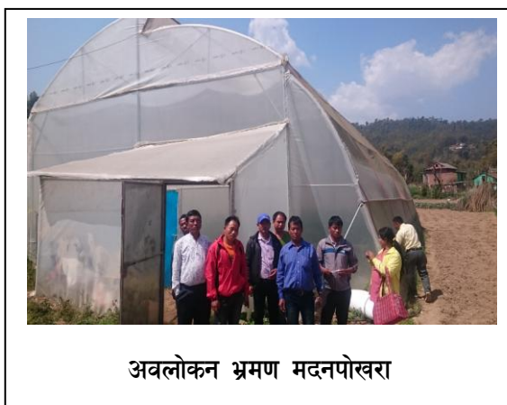
अवलोकन भ्रमण मदनपोखरा