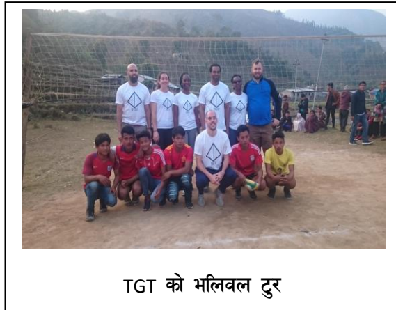
TGT को भलिबल टुर