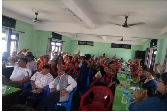
वित्तीय साक्षरता सचेतना कार्यक्रम, कावासोती