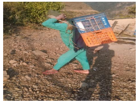
तरकारी बजारमा ढुवानी गरिदै बसेनी