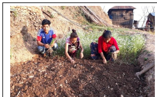
स्वयंसेवकहरूद्वारा फार्ममा काम गर्दै