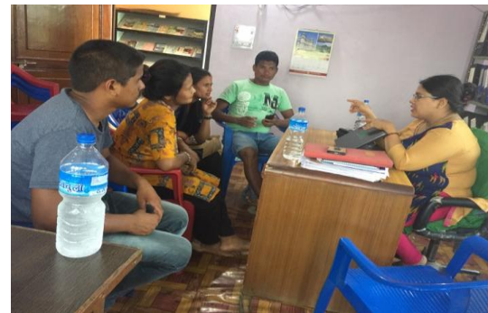
आप्रवासी स्रोत केन्द्रमा सेवाग्राहीलाई परामर्श

नेपाल सरकार तथा स्वीस ईन्टरकोअपरेसनविच भएको सम्झौता अनुसार हाल नेपालमा सुरक्षित आप्रवासन परियोजना हेल्भेटास नेपालले संचालन गरिरहेको छ । यसै क्रममा सामी हेल्भेटास स्वीस ईन्टरकोअपरेसन नेपालको साभेद्वारीमा हिमालयन सामुदायिक विकास मञ्च कावासोती, नवलपरासीले १३ फेब्रुवरी २०१४ देखि नवलपरासी जिल्लामा तत्कालिन सूचना केन्द्र (हाल आप्रवासी स्रोत केन्द्र) स्थापना गरी सुरक्षित आप्रवासन परियोजना संचालन गरिरहेको छ । १६ सेप्टेम्बर २०१८ देखि १५ जुलाई २०१८ (१ असोज, २०७५ देखि ३१ असार, २०७६) सम्मको सुरक्षित आप्रवासन परियोजना अन्तर्गत सम्पन्न गतिविधि तथा प्रगतिहरू समेटी यो प्रतिवेदन तयार पारिएको छ ।