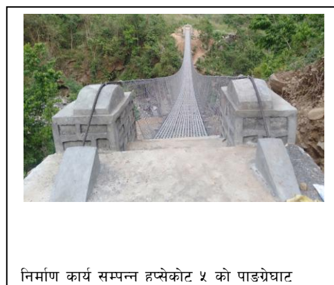
निर्माण कार्य सम्पन्न हप्सेकोट ५ को पाङ्ग्रेघाट