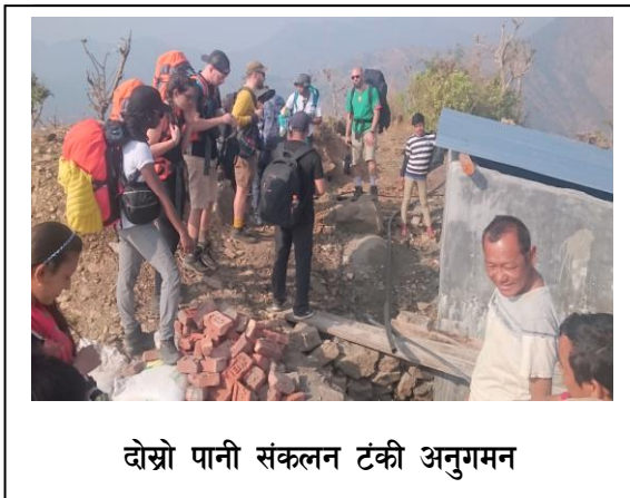
दोस्रो पानी संकलन टंकी अनुगमन