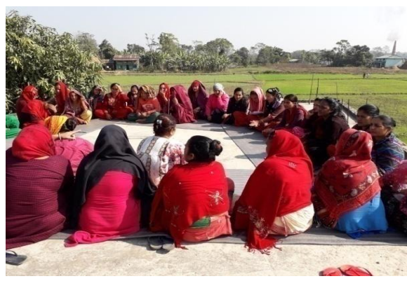
वित्तीय साक्षरता तथा मनोसामाजिक परामर्श कक्षा