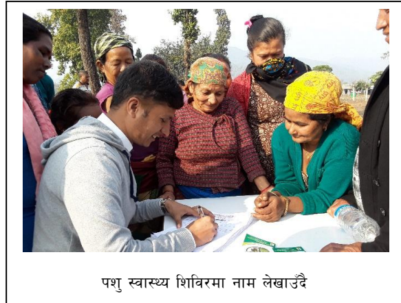
पशु स्वास्थ्य शिविरमा नाम लेखाउँदै