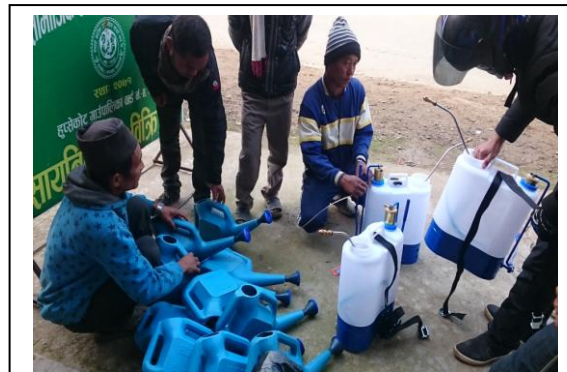
कृषी सामाग्री वितरण