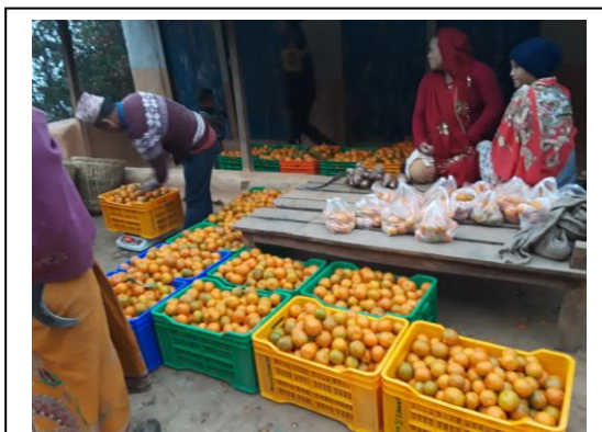
सहकारीद्वारा सन्तलाको संस्थागत बजारीकरण गरिदै