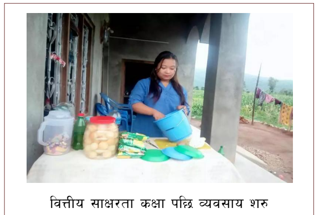
वित्तीय साक्षरता कक्षा पछि व्यवसाय शुरु