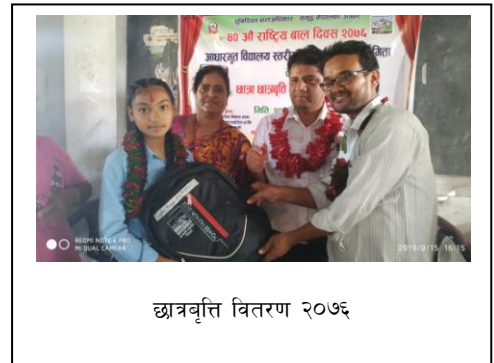
छात्रवृत्ति वितरण २०७६