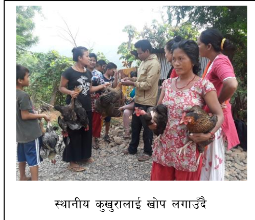
स्थानीय कुखुरालाई खोप लगाउँदै

यो सवै स्वार्थलाई जितेर सहकारीले नतिजा हासिल गर्न सक्षम बनाउन सहकारीमा पदाधिकारी र कर्मचारीको औपचारिक र अनौपचारिक भेटघाट र छलफल कुराकानी बाट क्षमता विकास गर्नका लागि सहजीकरण गर्ने योजना यस वर्ष अवलम्वन गरिने छ । नियमित विस्तृत योजना कार्यान्वयनका लागि विगत वर्षहरूको सिकाईलाई थप प्रभावकारी बनाई निरन्तरता दिने र सुधार योग्य कुराहरू लाई सुधार गर्दै अगाडी बढ्ने योजना अगाडी सारिएको छ । सरोकारवालाहरूसंगको सम्पर्क समन्वय र साभेदारीको विगतको अभ्यास लाई पनि प्रभावकारी ढंगले अगाडी बढाईने छ ।