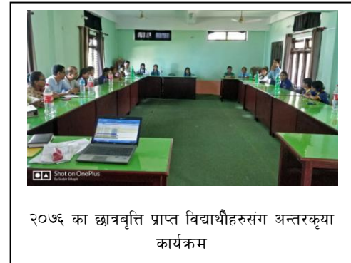
२०७६ का छात्रवृत्ति प्राप्त विद्यार्थीहरूसंग अन्तरकृया कार्यक्रम