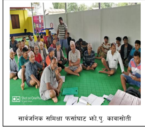
सार्वजनिक समिक्षा फर्साघाट भो.पु. कावासोती

सम्पन्न गरिएका भो.पु. को नामावली यस प्रकार रहेकोछ ।