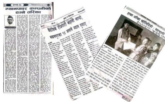
छापा संचारमा सुरक्षित आप्रवासन