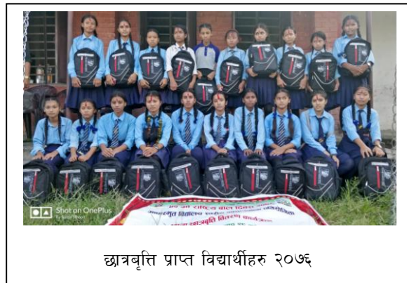
छात्रवृत्ति प्राप्त विद्यार्थीहरू २०७६

यहाँ असिमित आवश्यकताहरू छन् जसलाई राज्य तथा सामाजिक संघ संस्थाहरूको प्रयासले मात्र सम्बोधन गर्न अहिले सम्भव छैन । राष्ट्रिय जनगणना २०६८ अनुसार २५.६ प्रतिशत जनता निरपेक्ष गरिबीको रेखामुनी रहेको हाम्रो देशमा आफ्ना आधारभुत आवश्यकता गाँस, बास र कपास पनि पुरा गर्न नसक्ने अवस्थामा रहेका छन् । उनिहरूका लागि शिक्षा, स्वास्थ्य, बाटाघाटा, संचार आदी जस्ता जीवनका लागि नभई नहुने क्षेत्रमा पहुँच पुग्नु भनेको डाँडापारीको घाम भएको छ । यस मध्ये पनि राज्यले सम्बोधन गर्न नसकेका क्षेत्र तथा राज्य र सामाजबाट अछुतो बनेका लक्षित वर्गहरू गरिब, दलित, विपन्न तथा सिमान्तकृत समुदायहरू त्यसमा पनि महिला, बालबालिका, अपाङ्ग तथा धार्मिक अल्पसंख्यकहरू अति मारमा परिरहेका छन् । यि सवाल तथा समस्याहरूलाई मध्ये नजर गरी हिमालयन सामुदायिक विकास मञ्चले आफ्ना शुभचिन्तक, कर्मचारी तथा अन्य संघ संस्था तथा आम जनसमुदाय जो आफु बाँचेर देशका गरिबहरूको लागि केही गर्न सक्ने सामर्थ्य राख्दछ उनिहरूलाई देश तथा जनता प्रतिको दायित्वबोध गराउने तथा विकासमा सहकार्य वा सहभागिता जनाउन एउटा अवसरकोरूपमा यो हिकोडेफका मित्रहरू कार्यक्रम २०६८ साल देखि संचालनमा