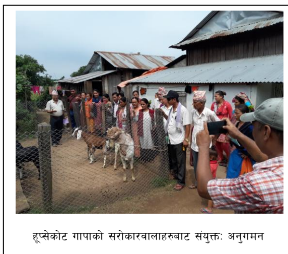
हूप्सेकोट गापाको सरोकारवालाहरूबाट संयुक्तः अनुगमन