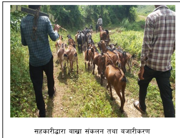
सहकारीद्वारा बाख्रा संकलन तथा बजारीकरण