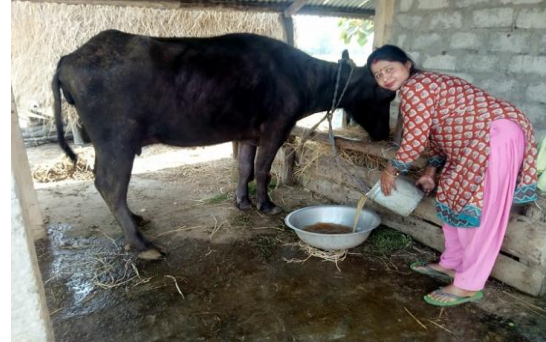
वित्तीय साक्षरता कक्षा पछि व्यवसाय शुरु