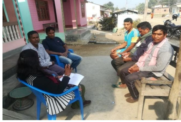
रिटर्नी स्वयंसेवकद्वारा घरभेट कार्यक्रम