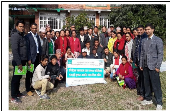
स्थानीय सरकारका पदाधिकारीहरूलाई आधारशिला तालिम