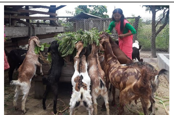
आधुनिक बाखापालन गर्दै किसान

हिकोडेफले भोक र गरिबी विरुद्धको लडाई गर्दै आईरहेको हेफर इन्टरनेशनल नेपालसंग सन् २००६ देखि सहकार्य गरि साना किसान, गरिब समुदायको आर्थिक तथा सामाजिक विकासमा टेवा पुर्याउदै आईरहेको छ । तत्कालिन गाविसका हरेक घर परिवार नछुट्ने र नदोहोरिने नीति सहित महिला समुह गठन गरी ती समुहहरू मार्फत महिलाहरूको शसक्तिकरण, आय आर्जन, दुध तथा खसी बोकाको आयात निश्चित प्रतिशतमा प्रतिस्थापन गर्ने उद्देश्य सहित सञ्चालन भएको साना किसान उद्यमी सबलिकरण परियोजना ( SLVC-I) को कार्यक्षेत्रमा उत्पादन र उत्पादकत्व बृद्धि गर्ने पहिलो परियोजनाको लक्ष्य प्राप्त भएको मानी साना किसानहरूको उक्त उत्पादन लाई बजार सम्म पुर्याउन सहजीकरण गर्ने उद्देश्यले चालु