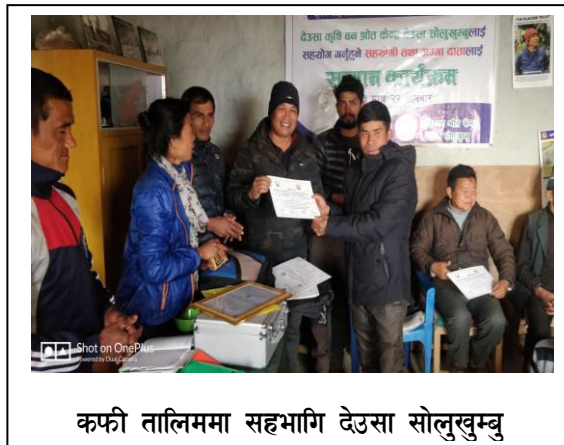
कफी तालिममा सहभागि देउसा सोलुखुम्बु