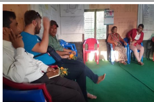
स्थानीय सहकारीसंग बजारीकरण बारे छलफल