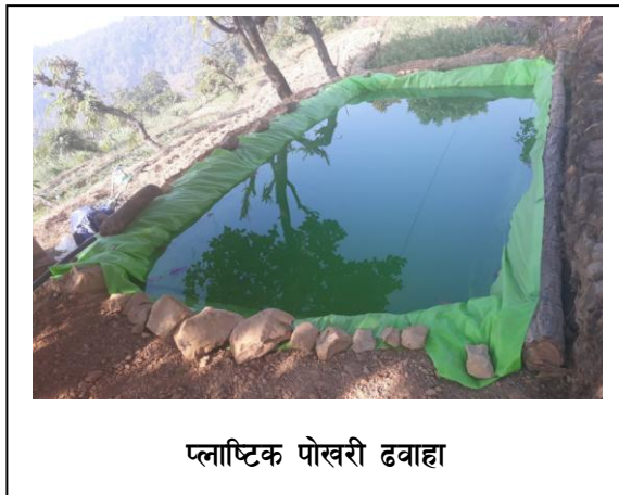
प्लाष्टिक पोखरी ढवाहा

यस वर्ष यस परियोजना अन्तर्गत प्लान्ट क्लिनिक, अनुकुलन योजना, जलवायु अनुकुलित विउ वितरण, उपकरण सहयोग, कृषी जे.टि.ए. स्वयंमशेवक परिचालन, बजारीकरणका साथै स्थानीय तहका सरोकारवालाहरूसंगको समन्वय तथा अनुगमन, मुल्यांकन जस्ता क्रियाकलापहरू संचालन गरेकोछ । यस प्रतिवेदनमा सन् २०१८ अगष्ट देखि जुलाई २०१९ सम्म ति लक्षित क्षेत्रमा गरिएका क्रियाकलापहरूलाई समावेश गरिएकोछ ।