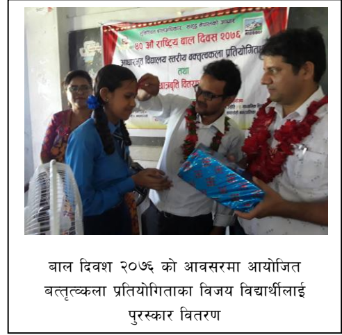
बाल दिवस २०७६ को अवसरमा आयोजित वक्तृत्वकला प्रतियोगिताका विजय विद्यार्थीलाई पुरस्कार वितरण