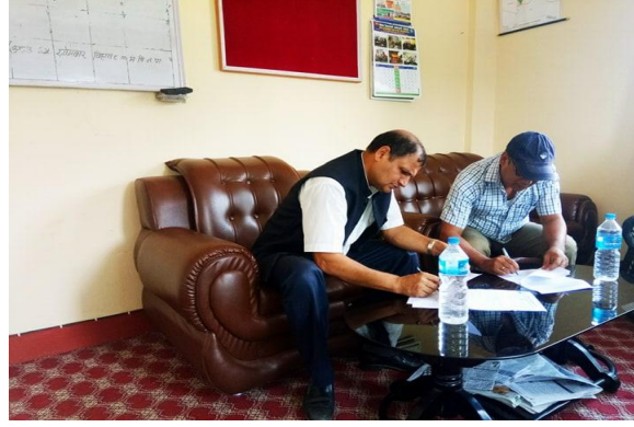
मध्येविन्दु नगरपालिकासंग सहकार्यका लागि सम्झौता

आ.व. २०७५/०७६ जिल्ला प्रशासन कार्यालयबाट एमआरपी लिएका व्यक्तिहरूको संख्या तथा वैदेशिक रोजगारीमा महिला कामदारहरू बढी रहेको तथ्यांकको आधारमा सामाजिक परिचालन गर्न नवपरासी (वर्दघाट सुस्ता पूर्व) जिल्लामा यस वर्षका लागि चारवटा नगरपालिका (कावासोती, मध्येविन्दु, गैडाकोट र देवचुली) तथा दुई गाउँपालिका (हुप्सेकोट तथा बौदीकाली) छनोट गरी परियोजना कार्यान्वयन भईरहेको छ । उक्त क्षेत्रहरूमा १४ जना रिटर्नी स्वयंसेवक परिचालन तथा समुदाय स्तरीय अभिमुखी कार्यक्रमहरू संचालन गरियो ।