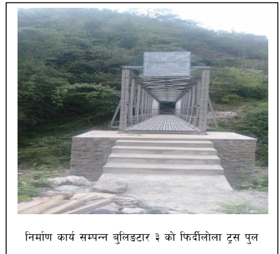
निर्माण कार्य सम्पन्न बुलिङटार ३ को फिदीलोला टूस पुल