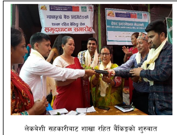
लेकवेशी सहकारीबाट शाखा रहित बैकिङ्गको शुरुवात

परियोजनाको अवधारणा अगाडी बढाईएको हो । गरिबीको चत्रमा पिल्सएका किसानहरूलाई पशु तथा कृषी जन्त्य उत्पादनहरूको व्यवसायिकरण तथा बजारीकरण गरि गरिबी न्युनिकरण गर्न अधिल्लो परियोजनाद्वारा स्थापना भएका सहकारीहरूको संस्थागत विकास गर्ने उद्देश्यका साथ यस संस्थाले बर्दघाट सुस्ता पूर्व नवलपरासी जिल्लाको २ नगरपालिका र २ गाँउपालिका (मध्यविन्दु नगरपालिका देवचुली नगरपालिका, हुप्सेकोट गाँउपालिका र बुलिङटार गाँउपालिका) को ५ ओटा सहकारीहरू (लेकवेशी, अरूण ज्योति, हुप्सेकोट, मैनाघाट तथा जौवारी) मा पशुवस्तुको मुल्यश्रृंखलामा आधारित साना किसानहरूको संस्था सबलिकरण परियोजना (SLVC II) कार्यक्रम सञ्चालन गरेको छ । तर यस परियोजनाले समग्र उत्पादनको बजारीकरण, वित्तिय सेवामा पहुँच सहकारी मार्फत न्यवसाय विकासका सेवाहरू प्रदान, शेयर सदस्यहरूको उत्पादनमा सहयोग लगायतका अन्य विभिन्न विधामा पनि सहयोग र समन्वय गरि रहेको छ । यस परियोजनामा स्थानीय सरकार प्रादेशिक सरकार र संघिय सरकारहरूबाट समेत लागत सहभागिता जुटाउने र सहकारीहरूको संस्थागत विकास उत्पादनमा आधारित विभिन्न किसिमका अनुदानहरू र अन्य विभिन्न किसिमका सहयोग र समन्वय गरिएको छ ।