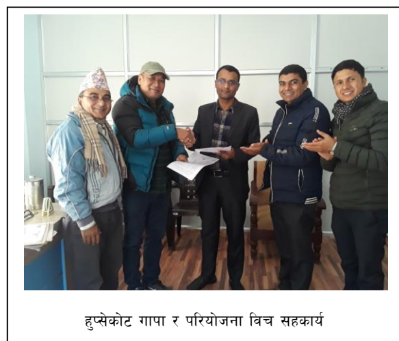
हुप्सेकोट गापा र परियोजना विच सहकार्य

सहकारी अनुसार संस्था, परियोजना र कर्मचारीलाई हेर्ने नजर फरक छ, उनीहरूको हामी प्रतिको विश्वास र चासो पनि सोही अनुसार फरक छ त्यसैले संस्थाले पनि चालू वर्ष देखी उनीहरूलाई गर्ने न्यवहारमा सोही अनुसारको राणनीति अवलम्बन गर्ने योजना अगाडी सारेको छ । कही कर्मचारीका स्वार्थ, कहि सञ्चालक समितिका पदाधिकारीको स्वार्थ र कहीं असंलग्नहरूको स्वार्थका कारण सहकारीका प्रगतिमा बाधा पुगेको महशुस भई