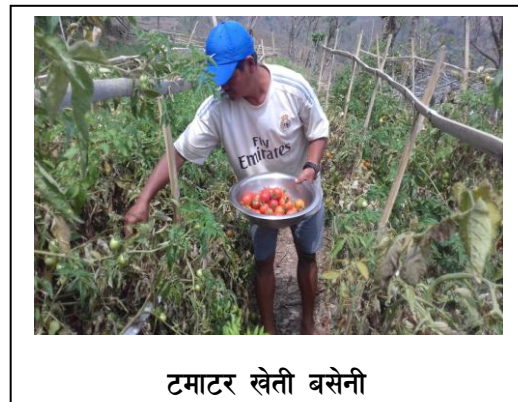
टमाटर खेती बसेनी

यस परियोजनाले औपचारिक तथा अनौपचारिक तरिकाबाट समुदायलाई उपलब्ध गराउँदै ति ज्ञान तथा सिपहरूलाई वास्तविकरूपमा आफ्नो जिविकोपार्जन बृद्धिको लागि व्यवहारिकरूपमा प्रयोग गर्न अभिप्रेरित गर्दछ । यसले स्थानीय पर्यावरण ज्ञानलाई अभिवृद्धि गरी आधुनिक दिगो कृषी प्रणाली तथा वातावरण संरक्षण र जलवायु परिवर्तन सम्बन्धि सचेतना अभिवृद्धि गर्न मद्दत गर्दछ । यस परियोजनाले जिविकोपार्जनका लागि विशेषत परम्परागत काम नलाग्ने परम्परागत अभ्यासहरू, र जलवायु परिवर्तन सम्बन्धि ज्ञानलाई प्रतिस्थापन गर्न शिक्षा तथा सिप विकास गरि प्राकृतिक स्रोतको उचित व्यवस्थापन जस्तै जलस्रोतको भण्डारण तथा व्यवस्थापन, आधुनिक कृषी प्रणालीको अभ्यास तथा उत्पादित वस्तुहरूको बजारीकरणमा जोड दिने गर्दछ ।