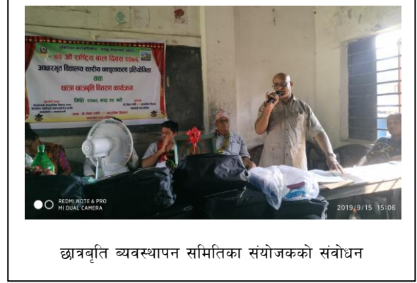
छात्रवृत्ति व्यवस्थापन समितिका संयोजकको संबोधन